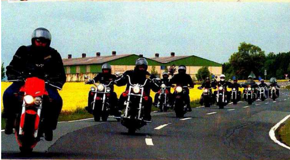
Die Wild Lions unterwegs auf der Herrentour

monatige Hängerphase und eine ebenso lange Probephase durchlaufen, bevor er einstimmig zum Vollmember ernannt werden kann. Die Aufnahme von Frauen ist nicht vorgesehen. Im Vergleich zu früheren Zeiten ist die Fluktuation heute sehr niedrig. Die Member sind zwischen 28 und 60 Jahre alt und treffen sich regelmäßig mittwochs und freitags am Clubhaus. In Garbsen sind keine Gründungsmitglieder mehr aktiv, in Beetendorf immerhin noch zwei.