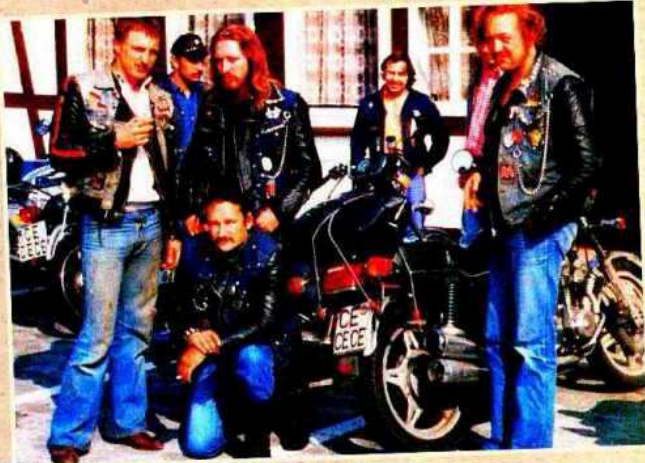
History: Ausfahrt in Celle

Die betagte Shovel wurde die erste Harley in Garbsen. Sie fuhr unter den Farben des Wild Lions MC